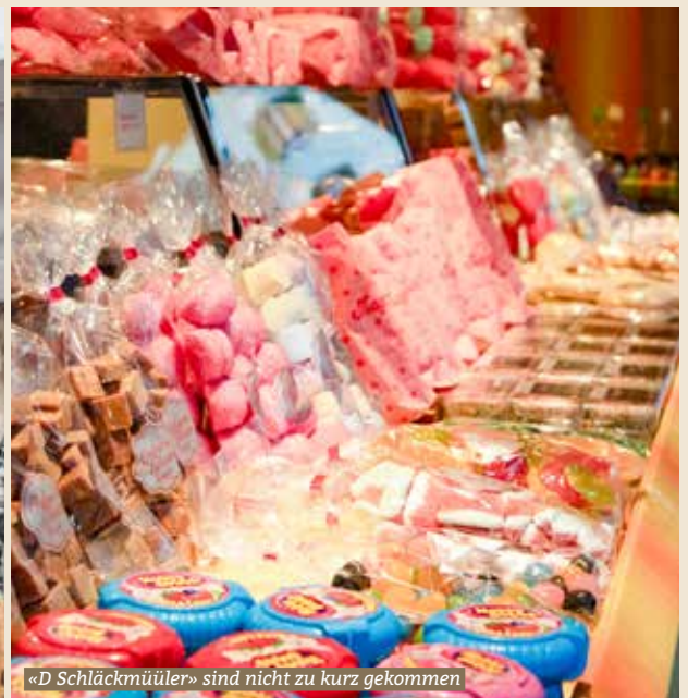
«D Schläckmüüler» sind nicht zu kurz gekommen

Der Baumer Herbstmarkt hat Tradition. Jedes Jahr findet man unzählige Stände wie auch Abendunterhaltung. Die Waren werden liebevoll hergerichtet und man findet allerhand Kreatives und Leckeres – das macht Lust auf einen Spaziergang durch die Marktassen.