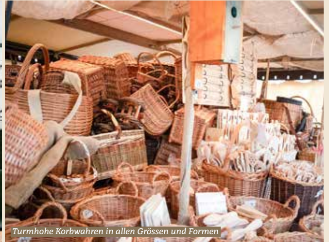
Turmhohe Korbwaren in allen Grössen und Formen