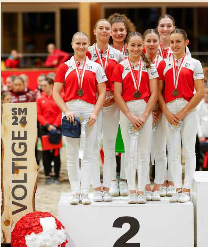
Als Veranstalter der Schweizermeisterschaft vom 27. bis 29. September befand sich das Zentrum von Voltige Tösstal

für einmal nicht in der Rundhalle in der Widen, sondern im Horse Park Zürich Dielsdorf. Nicht nur organisatorisch, sondern auch sportlich blicken wir auf einen Event der Superlative zurück: Am Sonntagabend durften alle Töss-taler Voltigierinnen und Voltigierer mit mindestens einer Medaille nach Hause zurück kehren.