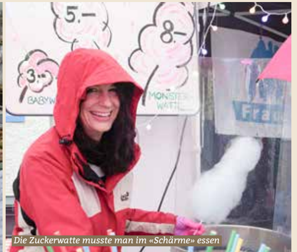
Die Zuckerwatte musste man im «Schärme» essen