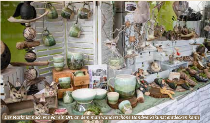
Der Markt ist nach wie vor ein Ort, an dem man wunderschöne Handwerkskunst entdecken kann