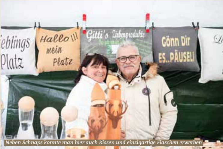
Neben Schnaps konnte man hier auch Kissen und einzigartige Flaschen erwerben