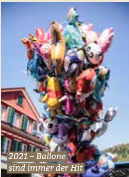
2021 – Ballone sind immer der Hit