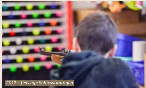
2017 – fleissige Schiessübungen