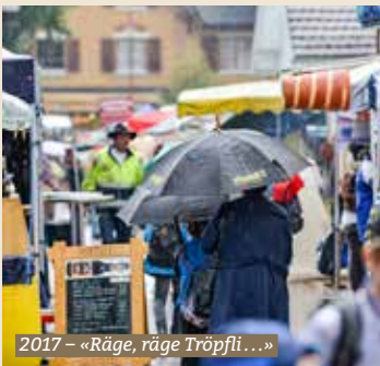
2017 – «Räge, räge Tröpfli...»