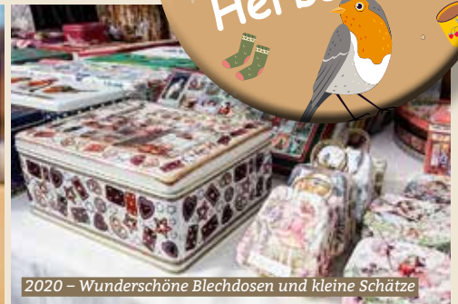
2020 – Wunderschöne Blechdosen und kleine Schätze