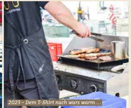
2023 – Dem T-Shirt nach wars warm...

Alle Jahre wieder kommt der Baumer Herbstmarkt, ein Ereignis, das auch schlechtes Wetter nicht stoppen mag. Märkte waren einst rein wirtschaftlich und Machtfaktoren, heute sind sie vor allem Tradition. Ob Frühling-, Herbst- oder Weihnachtsmärkte, sie sind ein Ort wo man sich trifft, verweilt und «Feins» geniesst. Durch die Stände bummeln, Leute beobachten und Düfte einatmen – Märkte haben ihren ganz eigenen Charme. Es ist eine Reise in bunte Welten, Handwerkskunst, Delikatessen- und Leckereienherstellung und lässt uns dabei etwas den alltäglichen Stress vergessen.