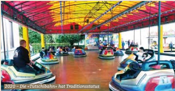
2020 – Die «Tütschibahn» hat Traditionsstatus