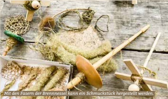
Mit den Fasern der Brennnessel kann ein Schmuckstück hergestellt werden.

Wie wäre es mit einer spannenden Weiterbildung im Herbst? Ein Wildkochkurs, wo man selber ein feines Essen zubereiten und nachher miteinander geniessen kann, steht ebenso zur Auswahl wie das Angebot zum Modellieren mit Ton an mehreren Abenden. Oder haben Sie gewusst, was man alles mit Brennnesseln machen kann?