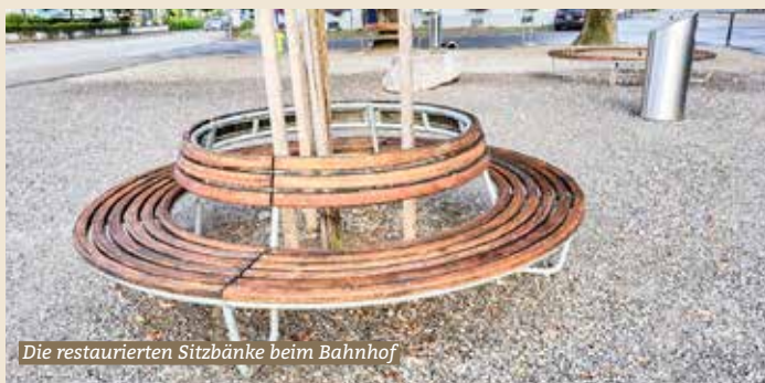
Die restaurierten Sitzbänke beim Bahnhof