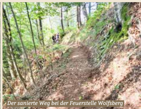
Der sanierte Weg bei der Feuerstelle Wolfsberg