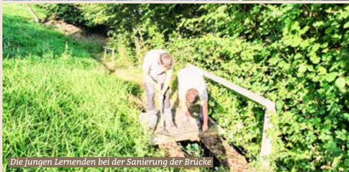
Die jungen Lernenden bei der Sanierung der Brücke