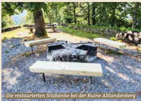
Die restaurierten Sitzbänke bei der Ruine Altlandenberg