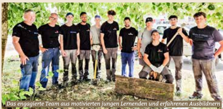
Das engagierte Team aus motivierten jungen Lernenden und erfahrenen Ausbildnern