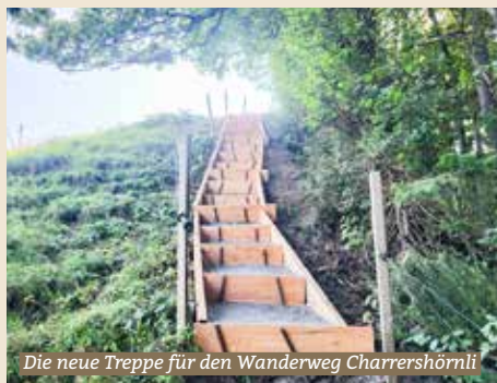
Die neue Treppe für den Wanderweg Charrershörnli