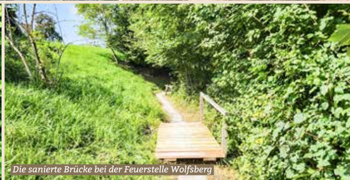
Die sanierte Brücke bei der Feuerstelle Wolfsberg