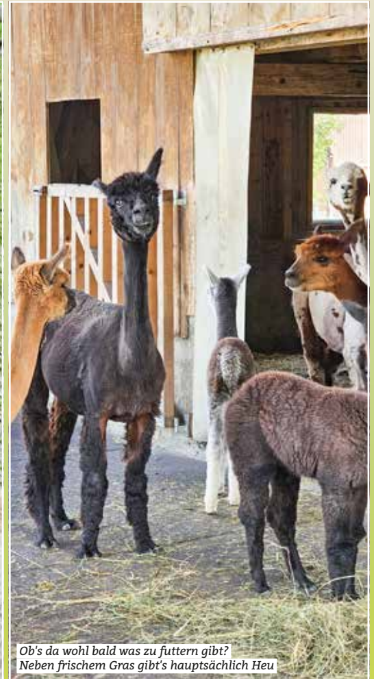
Ob's da wohl bald was zu futterm gibt? Neben frischem Gras gib't's hauptsächlich Heu