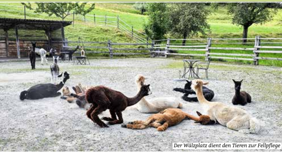
Der Wälzplatz dient den Tieren zur Fellpflege