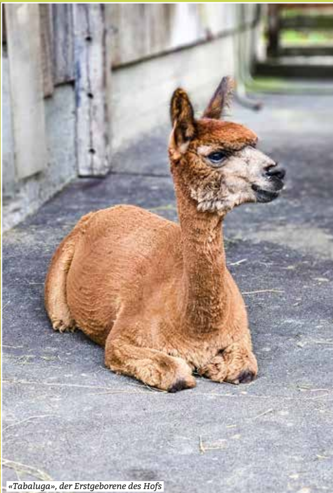
«Tabaluga», der Erstgeborene des Hof's