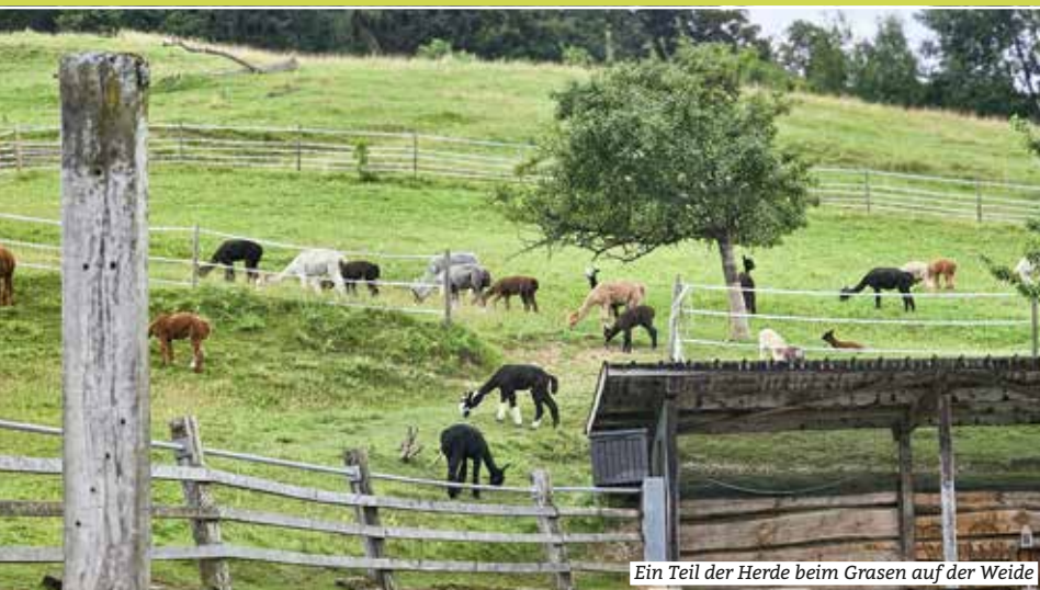
Ein Teil der Herde beim Grasens auf der Weide